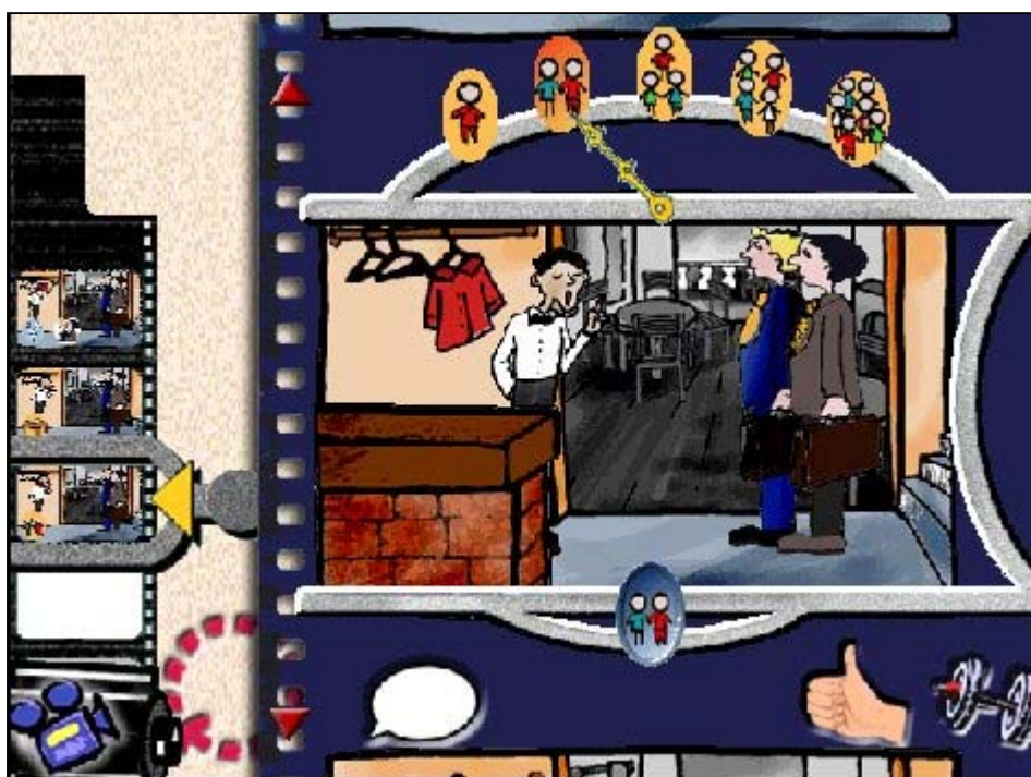
Figure 3 : La métaphore de la représentation cinématographique dans LIT .

En matière de conception des interfaces, les travaux menés ces dix dernières années montrent clairement l'intérêt de recourir à une ou plusieurs métaphores pour structurer le design des possibilités dialogiques offertes au sein d'un environnement d'apprentissage multimédia. Dans certains cas, la métaphore sera choisie assez librement en fonction d'une ambiance que l'on souhaite recréer, d'un clin d'œil que l'on veut adresser, d'une analogie que l'on veut mobiliser pour faciliter la mise en oeuvre de certaines fonctionnalités offertes par le logiciel. Dans d'autres circonstances, la métaphore s'imposera d'elle-même en fonction des compétences à installer chez l'apprenant et du contexte dans lequel ces compétences seront mises en oeuvre. Ainsi, par exemple, le choix de la métaphore de la représentation cinématographique ( figure 3 ) pour aider à visualiser le déroulement temporel d'une situation dans l'environnement d'apprentissage LIT , tout en cadrant assez bien avec l'ambiance générale du logiciel, offre une analogie fonctionnelle intéressante à exploiter par rapport à l'idée que chacun se fait de l'enregistrement puis du visionnement d'une séquence filmée. Dans ZincCast , c'est l'analyse des tâches qui nous a amenés à définir chacune des interfaces par analogie avec les activités que l'apprenant aura à prendre en charge en contexte réel.