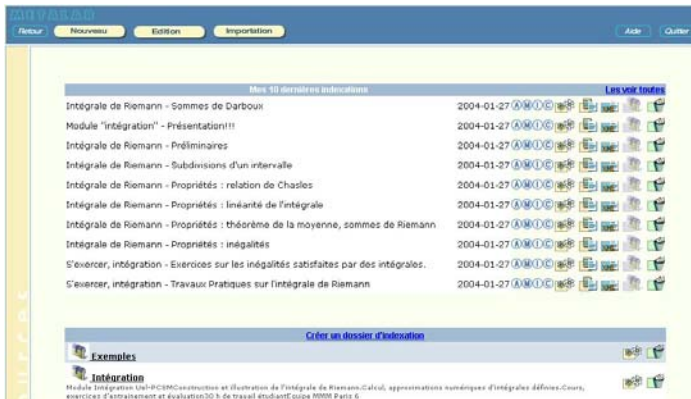
Ecran 1 : Extrait de l'étape auteur