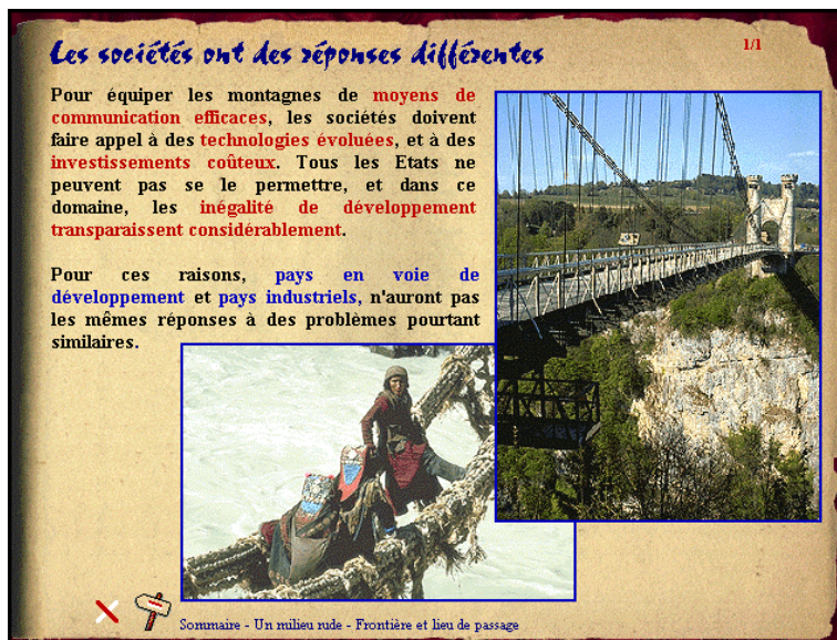
Copie d'écran d'une page de la partie documentaire

Pourquoi un livre ancien ? Pour permettre à un jeune lecteur de ne pas être trop « perdu », de retrouver des constantes scolaires... Par choix artistique : le vieux papier c'est plus joli... Parce que nous sommes des enseignants marqués par une culture de l'écrit et que cela fait partie de notre substrat socio-professionnel que nous tenons à conserver, même dans les NTIC.