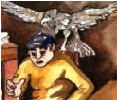
Augustin et Chevalier Noir