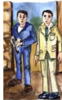
Chasseur et journaliste