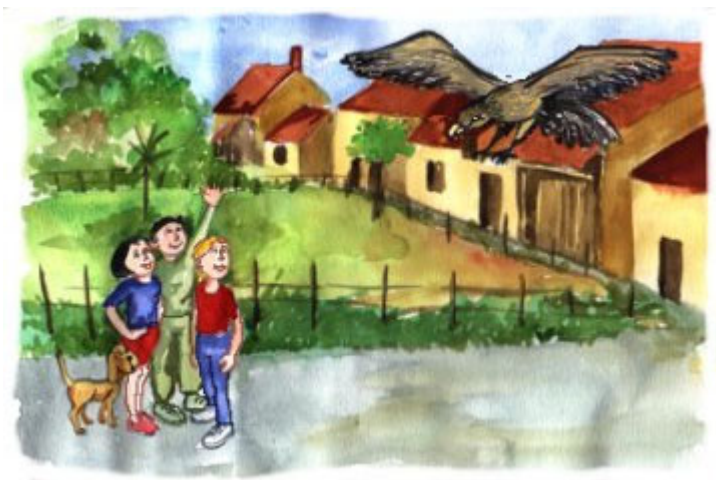
Exemple de fiche de lecture