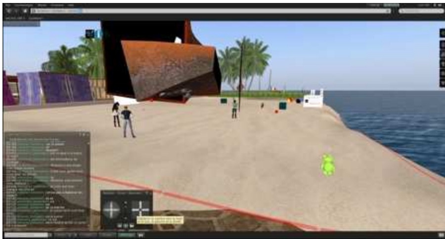
Figure 6 : écran de l'avatar-chercheur. Participants en mouvement

Une difficulté s'est présentée dans l'activité de construction. Comme on le voit dans la figure suivante, les apprenants construisaient un objet en collaboration. Ils étaient donc sans cesse en mouvement et le chercheur devait forcément se déplacer pour pouvoir capter les actions des apprenants.