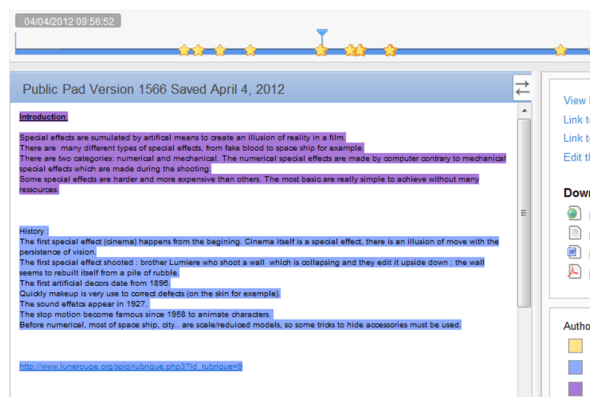
Illustration 1 - Exemple de production écrite dans le pad

EtherPad a généré un réel travail collaboratif concernant la production écrite, les apprenants ne se limitant pas au travail sur leurs propres productions.